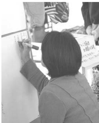
記事を書き込む皆さん