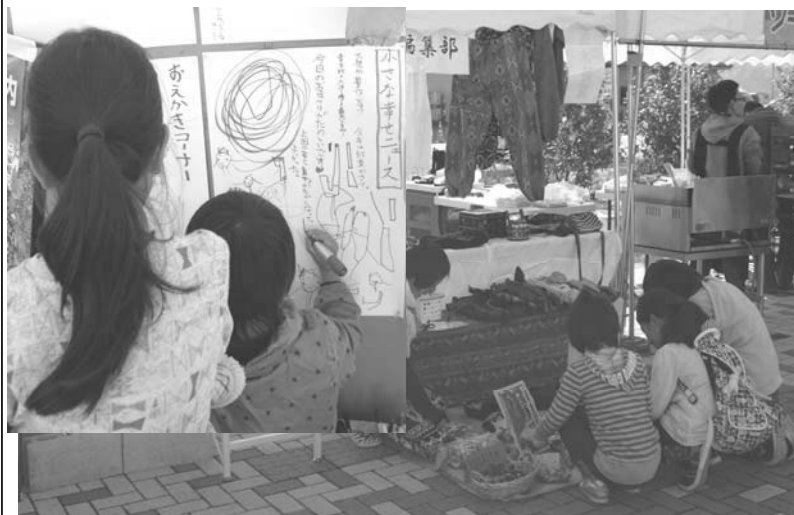
当日のブースの様子

2013年（平成25年）12月1日 第6号 発行：平成青木時報編集部 題字：三四六