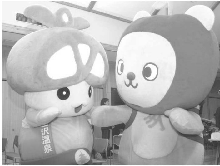
健闘をたたえあっている？ アオキノコちゃん (左) とアルクマ (右) ゆるキャラグランプリの詳細は http://www2.yurugp.jp/

アオキノコちゃん、位 (1560 キヤラ中) ゆるキャラグランプリの結果が 24 日に発表された。1 位は静岡県浜松市の「出世大名家康君」、2 位は群馬県の「ぐんまちゃん」、3 位は山口県宇部市の「ちよる」だった。 長野県 1 位はやはり「アルクマ」。全国では 10 位と健闘した。県内 2 位は坂城町の「ねずこん」、3 位は箕輪町の「まっくん」。 我らがアオキノコちゃんは県内 8 位と大躍進だ。今年 はテレビ出演をしたり、全国を回って青木村をアピールしたり、フェイスブックを始めたりと大活躍の 1 年だったアオキノコちゃん。編集部は来年も活動を見守ってきたい。